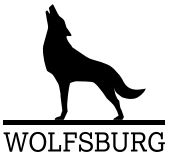
BILD UNGS HAUS WOLFSBURG